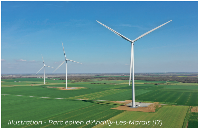
Illustration - Parc éolien d'Andilly-Les-Marais (17)

Depuis près de dix ans, le Groupe VALOREM s'investit dans le développement du parc éolien du Saint-Varentais, à l'est de la commune. À la suite de l'avis défavorable émis par la Préfecture des Deux-Sèvres en 2020, l'équipe VALOREM, en collaboration avec les élus de Saint-Varent, a choisi de proposer un nouveau projet encore plus aligné avec les enjeux environnementaux d'aujourd'hui et les attentes du territoire. Cette lettre d'information vous présente les nouvelles orientations envisagées et vous informe sur les compléments d'études à venir. Enfin, une collecte de financement participatif sera lancée début avril pour permettre à la population d'accompagner le développement du projet et de bénéficier de ses retombées économiques. Plus d'informations : voir au dos.